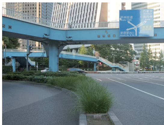
管理が困難な、中央分離帯での施工実績