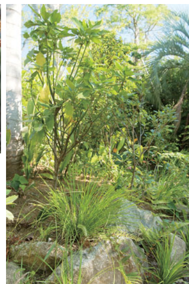
植栽計画にあった新アイテムとして採用 (よこはま動物園 スーラシア)