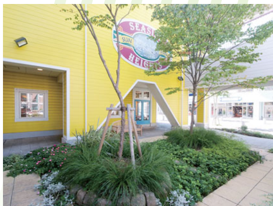
他の植栽とあわせトータルにコーディネート (三井アウトレットパーク 横浜ベイサイド)