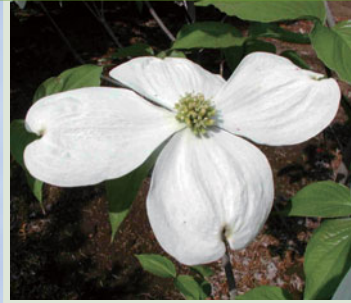
ハート型の大きな白い花