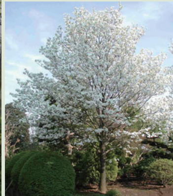
母樹(マザーツリー)