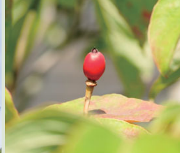
あざやかな色の赤い実