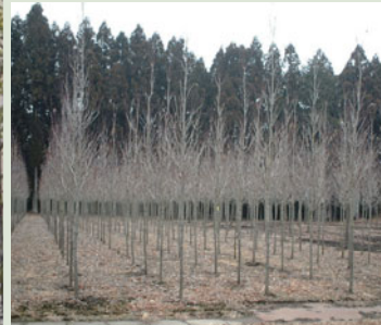
しなやかな枝ぶりの冬立木