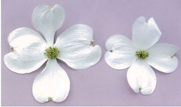
総苞を含む花序の比較(左: ホワイトラブ 右: 在来種)